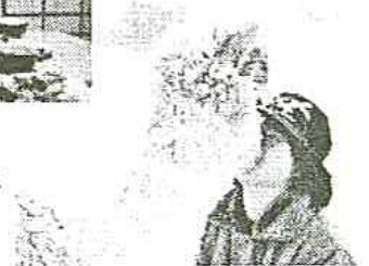
「冬のアルパカ」 原田裕司監督