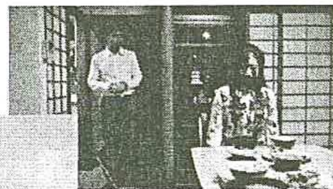
「half awake」 東條政利監督